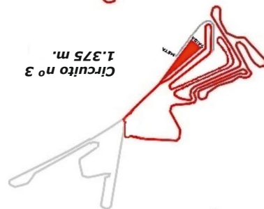
Circuito nº 3 1.375 m.