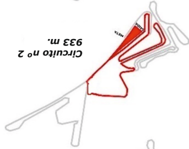
Circuito nº 2 933 m.