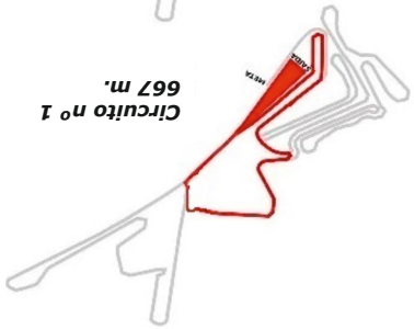
Circuito nº 1 667 m.

As voltas completas están medidas no punto de confluencia da cola de saída do circuito en sí, polo tanto a distancia de cada volta non é a mesma, posto que nas voltas intermedias non se fai cola de saída e ao facer a última volta non se fai o tramo que xunta o circuito á cola de saída, a entrada en meta así o require.