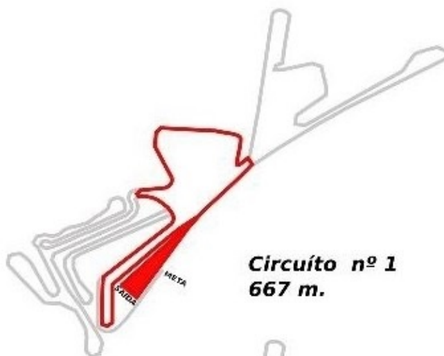
Circuito nº 1 667 m.