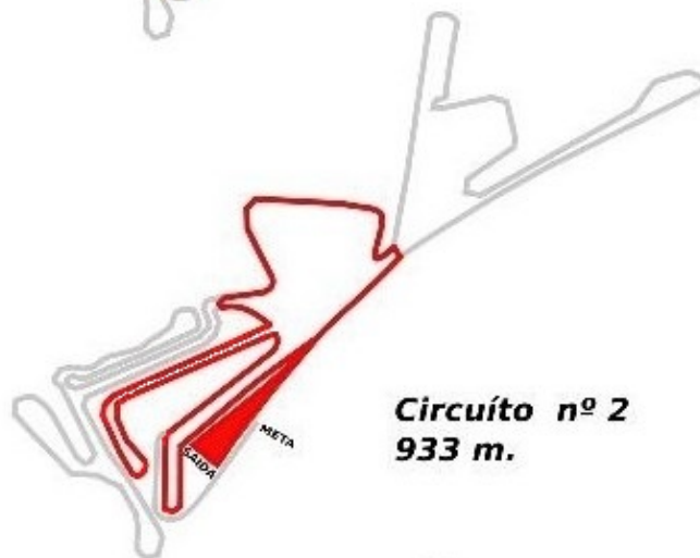
Circuito nº 2 933 m.